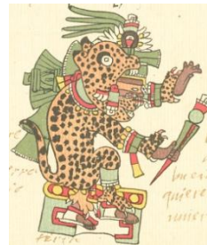
Tepeyollotl en el Codice Telleriano-Remensis.