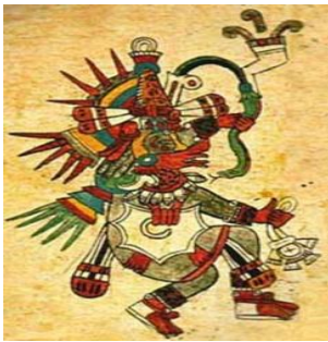
Representación de Quetzalcoatl en el Códice Borbonicus, p.22)